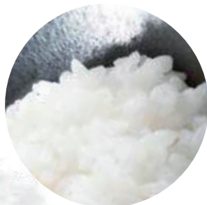
厳選した安心の国産米