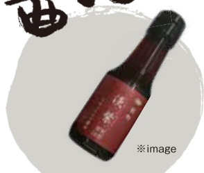
卵かけごはんには合う醤油